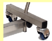
Kit chariot 4 roues (+2) adaptable tout inox