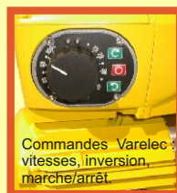
Commandes Varelec : vitesses, inversion, marche/arrêt.