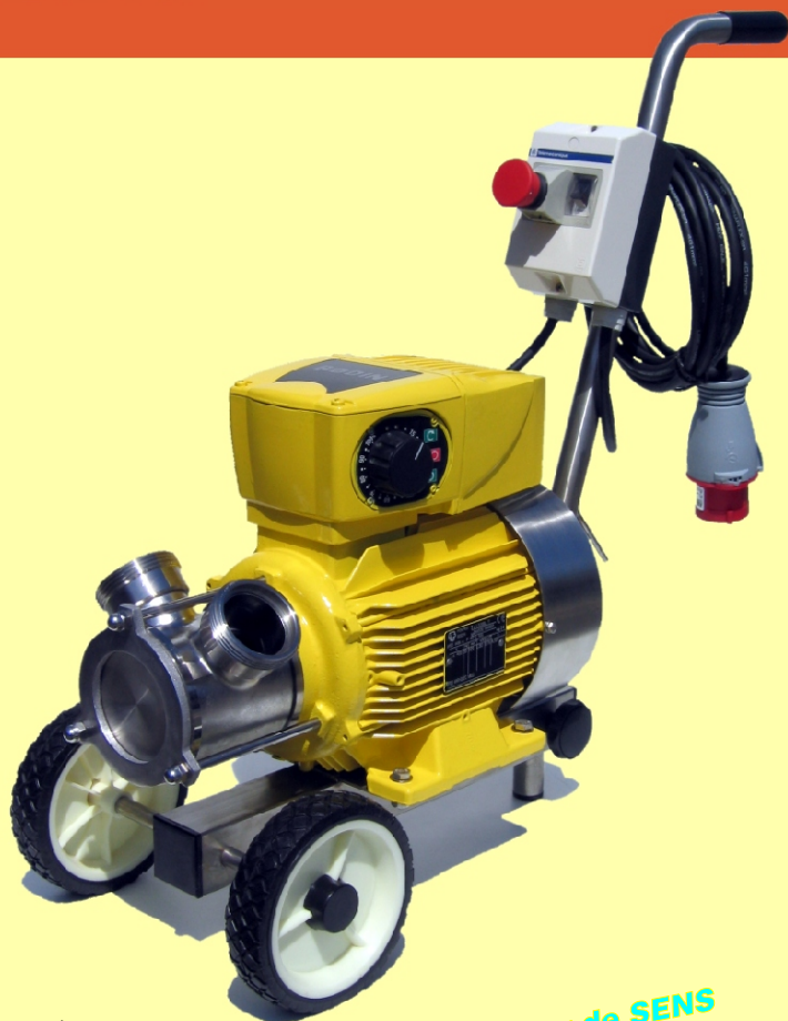
Modèle FP 20 Varelec

LED indicateur de SENS de Pompage rouge & verte